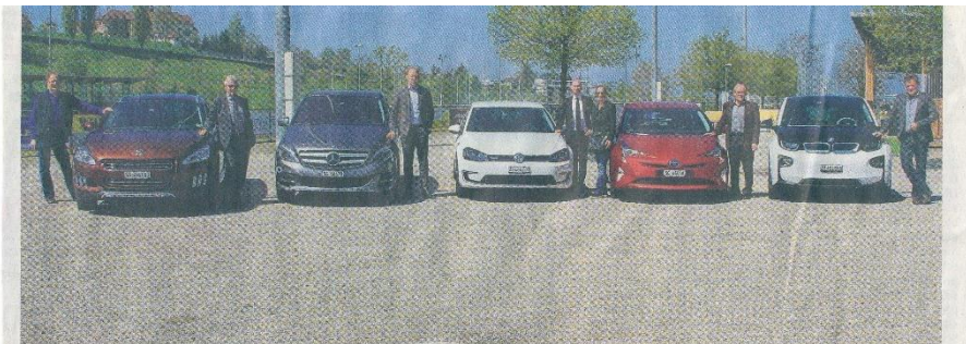
Gemeinderäte von Goldach und Garagisten aus der Umgebung zeigen die Autos, die eine Woche lang getestet werden durften.